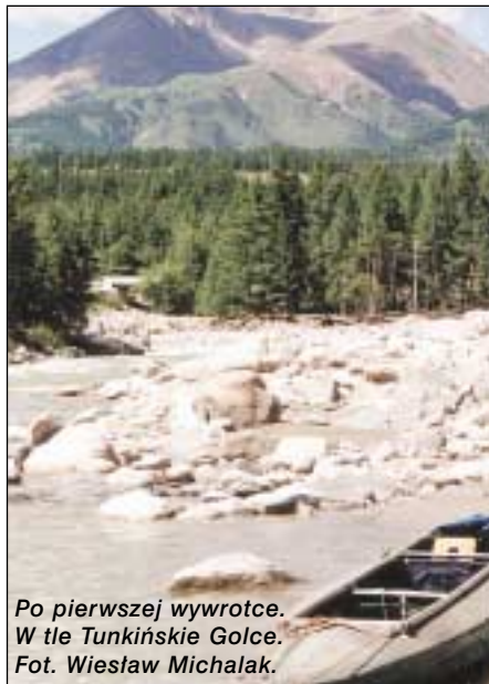
Po pierwszej wywrotce. W tle Tunkińskie Golce.

bajdarka – kajak, pielmieni – rodzaj pierożków, przewodnica – pani kuszetkowa, Poiskowo-Spasatielnij Otriad – Oddział Poszukiwawczo-Ratunkowy (rodzaj naszego WOPR-u połączonego z GOPR-em), działają na wodzie i w górach, kamanda – ekipa, kupe – przedział, omul – gatunek ryby występującej tylko w jeziorze Bajkał, krugobajkałka – lokalny pociąg poprowadzony wzdłuż południowo-zachodniego brzegu Bajkału, elektryczka – lokalny pociąg, tuman – mgła, skwiernyj – wredny, katy – katamarany, poputna maszyna – „okazja”, autostop, marszrutki – płatne busy kursujące pomiędzy wioskami.