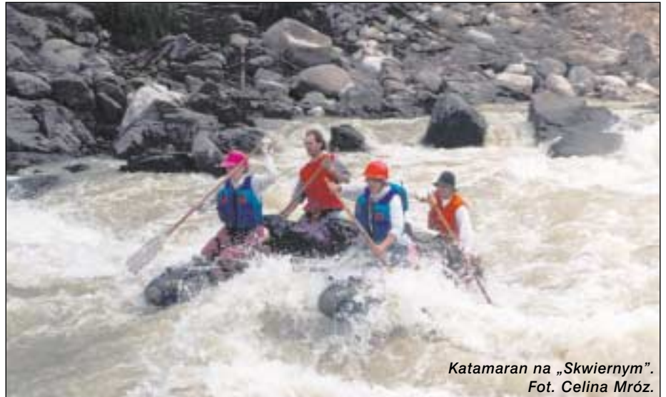
Katamaran na „Skwiernym”.

Jadąc samochodem ze Sludianki w górę Irkutu, około 200 km na zachód, obserwowałam jak góry stopniowo przybliżają się do rzeki i splecionej z nią drogi. Początkowo wyłaniały się na horyzoncie rozległe doliny, przed Mondami wyrastały stromo tuż za drogą i rzeką. Wieczorem stanęliśmy na biwak na łące nad Irkutem, nie dojeżdżając do Mond. Szczyty Tunkińskich Golców na tle ciemniejącego błękitu nieba wyglądały jak wycięte z czarnego papieru ostre trójkąty. Rzeka w tym miejscu rozdzielała się na dwie odnogi. Lewa, nad którą obozowaliśmy, pełna kamieni i mielisz, nie zapowiadała bystrzy za zakrętem. Nazajutrz, pod palącym słońcem, pano-