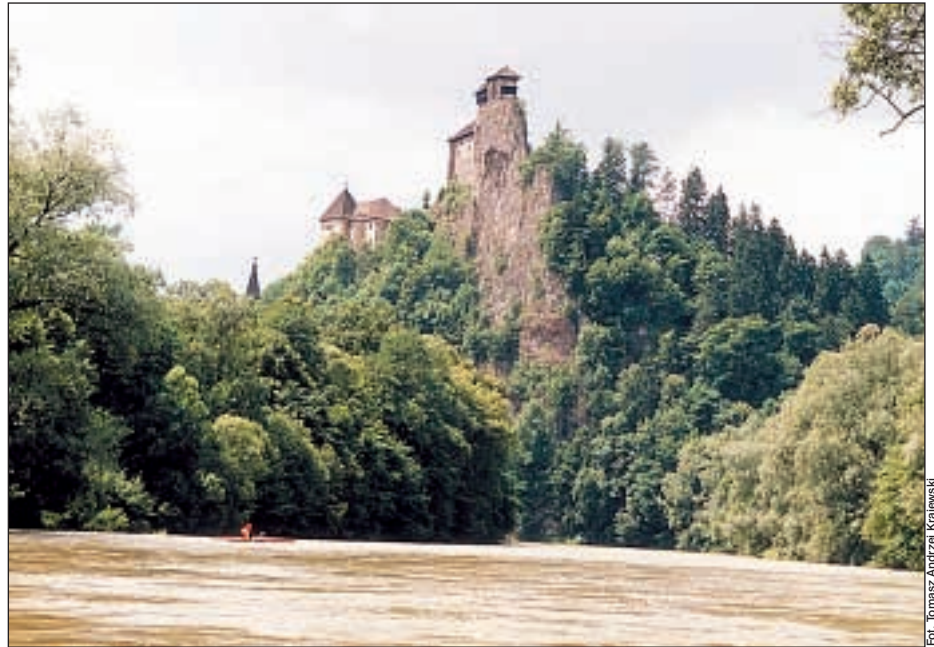
Oravský Hrad nad Oravou.

Dopływy Orawy według słowackich przewodników „Zapadne Tatry” i „Orava” do spływania w okresie wysokiej wody. Zasadniczo w czasie topnienia śniegów są też dostępne rzeki: Biela Orava (Oravska Lesná – Namestovo, 33 km, 4,5 ‰, WW II), Oravica (Vitanova – Tvrdošín, 21 km, 7,9 ‰, WW II), Zazrivka (Zazriva – Parnica, 16 km, 12 ‰, WW III).