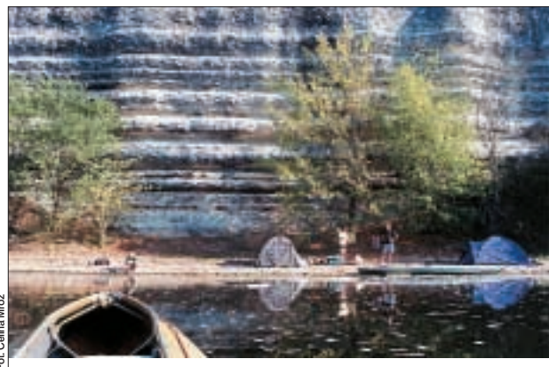
Tutaj o świcie pokazał się jeleń z Lascaux.

Ach, co to był za splyw! Na każdej wyprawie kajakowej zdarzy się zawsze coś, czego jest albo za mało, albo za wiele. Uniknąć tego nie da się, wyjeżdża się przecież po przygodę. Tym razem we Francji mieliśmy wszystkiego na miarę, w sam raz. Trafiliśmy na wodę, na której powtórka z Irkutu nie groziła, niemniej nie nudziliśmy się. Szlak był nieporównanie lżejszy niż Dunaj w Niemczech, na którym zmagaliśmy się z przenoskami, choć nasze wózki i we Francji toczyły się tak blisko, że już, już moglibyśmy narzekać na nudę kempingów, wszędzie obecne samochody itp., ale umieliśmy odizolować się od niej. Tak można by o wszystkim. Mam tylko wątpliwości, czy wina nie wypiliśmy w słodkiej Francji za mało. Ale czy może ktokolwiek z nas szczerze powiedzieć, że wina było dosyć?