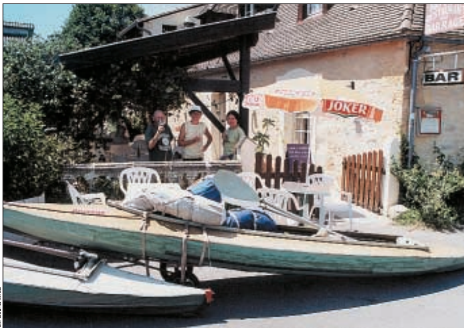
Przenoska osłabia, piwo krzepi.

Za winnicą zauważam drewnianą szopę z przybudówkami, przy niej człowieka. Chłop francuski jak się patrzy: siedemdziesiąt lat, brzuchata postura, jowialna twarz, czerwonny nos. Uśmiecham się miło i opowiadam; jesteśmy Polakami, kajakarzami, chcemy postawić dwa namioty. Ku mojemu zaskoczeniu facet wcale nie jest zachwycony możliwością spotkania się z nami, goszczenia nas na swojej ziemi. Bierze mnie w krzyżowy ogień pytań. – Dlaczego chcemy postawić namioty właśnie u niego? Skąd wiedzieliśmy, że tutaj jest łąka? Jak odgadł, że on akurat przyjechał. Wiję się jak piskorz, wyjaśniam to, czego wyjaśnić nie sposób. W końcu wieśniak niechętnie godzi się na nasze obozowisko.