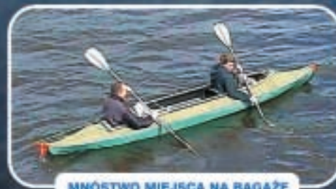
MNÓSTWO MIEJSCA NA BAGAŻE