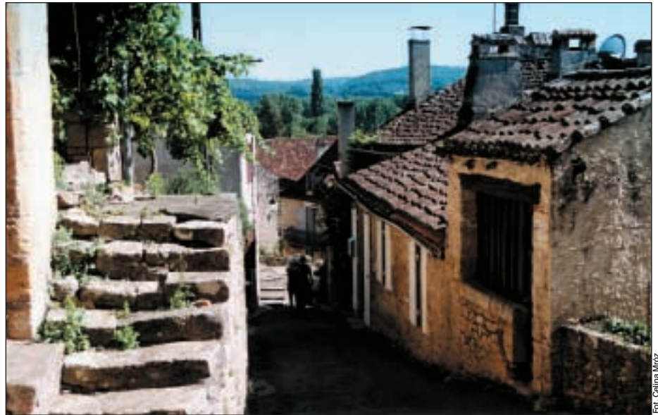
Miasteczko jak z bajki – Limeuil u zbiegu Vezere i Dordogne.